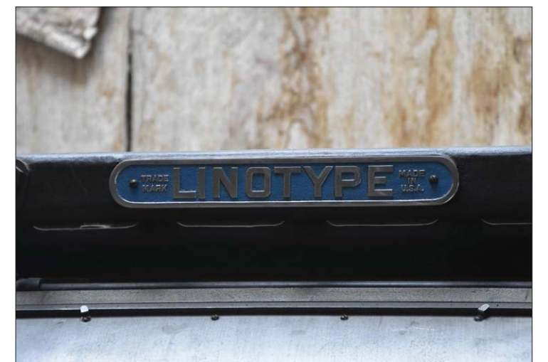
Varemerket er Linotype.