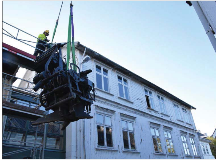
Her går den tunge settemaskinen inn for landing.