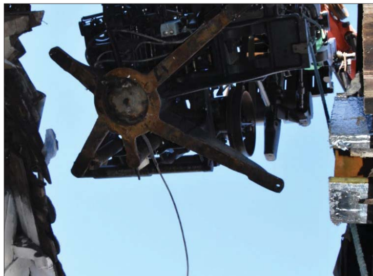
Slik så det uten innefra da den tunge maskinen ble løfte ut av rommet.