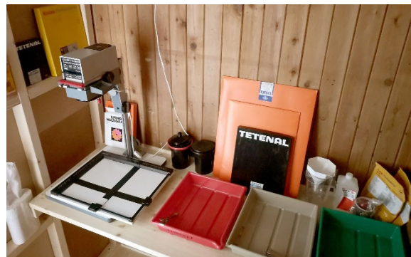
Rekonstruksjon av mørkerommet, finansiert av Kulturrådet.

Europarådet og EU-kommisjonen har gitt oss et tilskudd på €9.900 til et internasjonalt prosjekt i rekruttering og opplæring i bruk av settemaskiner. Tilskuddet kommer fra «European Heritage Days Stories», som Kulturminnedagene i Norge er en del av. Prosjektet har bragt utenlandske entusiaster til Norge og avsluttes i 2024 i Leipzig i samarbeid med Museum für Druckkunst. Prosjektet har gitt oss en rekke nye internasjonale kontakter. Prosjektet «Det komplette førdigitale avishus», med tilbakeføring av redaksjon og ekspedisjon til slik det var fram til 1975 har gått over to år og ble avsluttet i 2023. Norsk Kulturråd har støttet prosjektet med 120.000 kr.