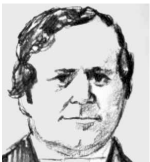
Christian Michael Schibsted, typograf og redaktør